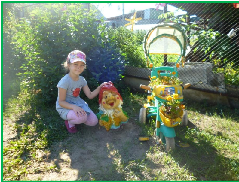
«В гостях у гнома»