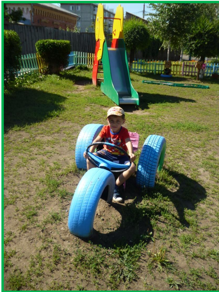
«Еду, еду в соседнее село...»