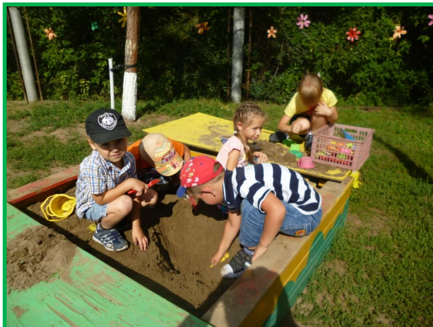
Песочница, песочница, Построить столько хочется!